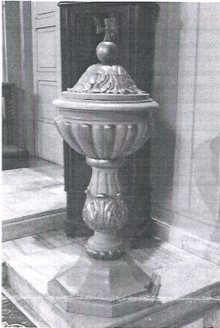
Chrzcielnica przed konserwacją.

WOJEWODZKI URZĄD OCHRONY ZABYTKÓW w Warszawie DELEGATURA W PŁOCKU 09-400 Płock, ul. Zduńska 13A tel. 262 76 71, fax 262 76 52